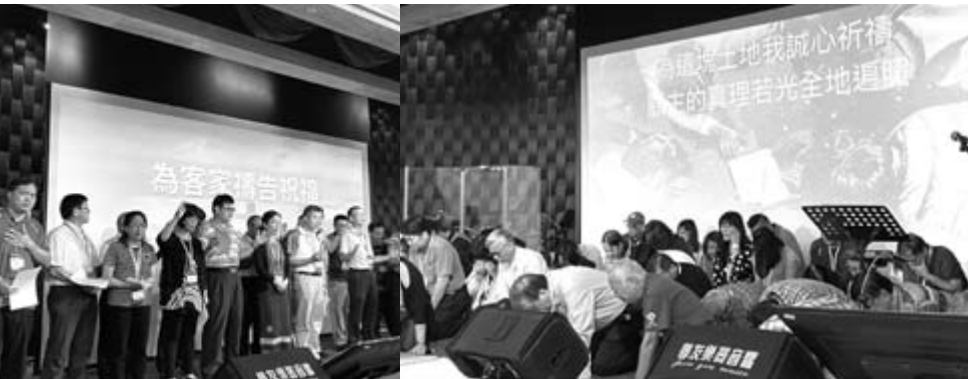
「國度合一，家人同行」，眾教會合一就產生極大影響力。

的教會，而是要重用我們合一所產生的影響力。因此我們關切神對台灣、華人命定更甚於疫情、饑荒等災難。若只關注這些，教會卻不一榮耀神，預備的意義何在？