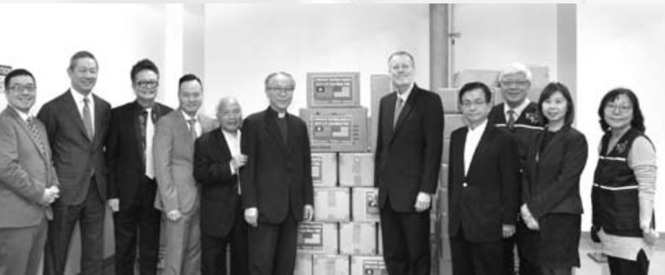
透過美國在台協會，捐助美國防疫物資。

無論是瘟疫、戰爭、蝗災、地震，聖經都已清楚預言；那該如何預備末世，等候主來？聖經的預備比較不是著重物質上的，而是屬靈和生命上的。因耶穌說：「你們要時時儆醒，常常祈求。」（路加福音21:36）彼得也說：「萬物的結局近了。所以，你們要謹慎自守，儆醒禱告。最要緊的是彼此切實相愛。」（彼得前書4:7-8）