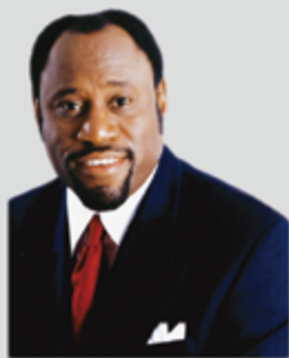
麥斯·蒙洛博士 Dr. Myles Munroe