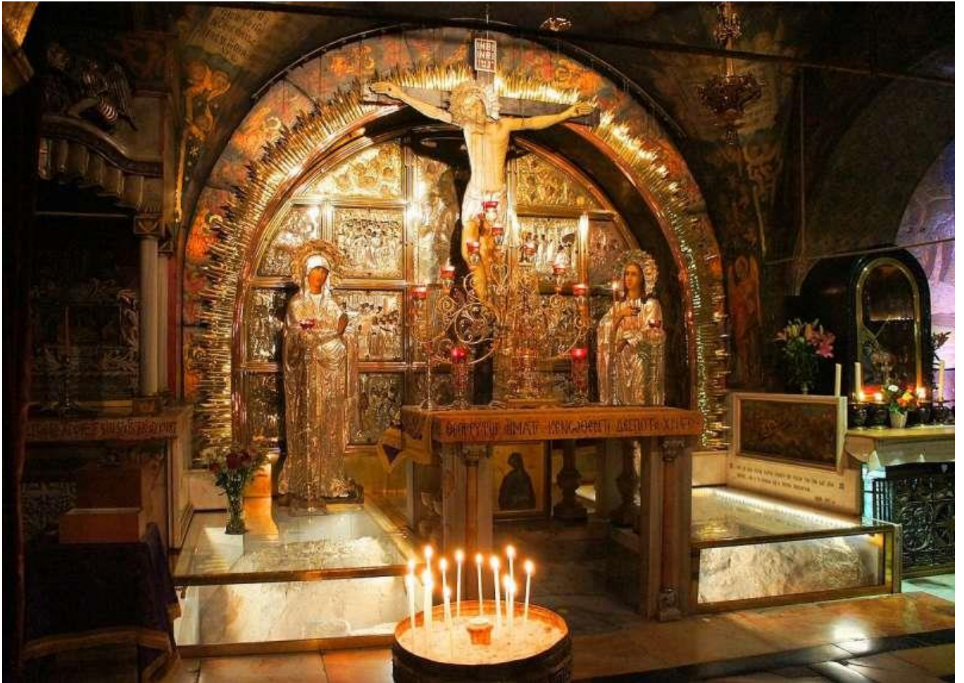
聖墓教堂內的耶穌聖像

傳統的說法中，耶穌在早上 9 點上十字架，下午 3 點斷氣，據說斷氣當時有 3 件事發生：第一，在聖殿的屋頂上號角響起，表示獻祭時間到了；第二，發生地震，十字架下的岩石裂開；最後，聖殿內的帷幕從上向下裂開。耶穌最後一句話說：「成了」，成了什麼？祂作為祭品的任務完成了，人類與天主的「新約」成立了，從此天主由聖殿內走入人群之中，每個人可以自由地向天主溝通，不需再到特定地點，由特定的人代為禱告。