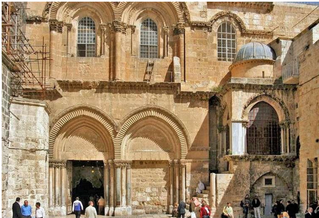
聖墓教堂門口

聰明的皇太后下令：找來 3 個麻瘋病人，讓他們分別接觸其中一個十字架，還真的有個病人不藥而癒，於是確定這個刑具就是「真十字架」，既然找到各各他和真十字架，那麼根據〈約翰福音〉19：41 的記錄，耶穌的墳墓就在附近。