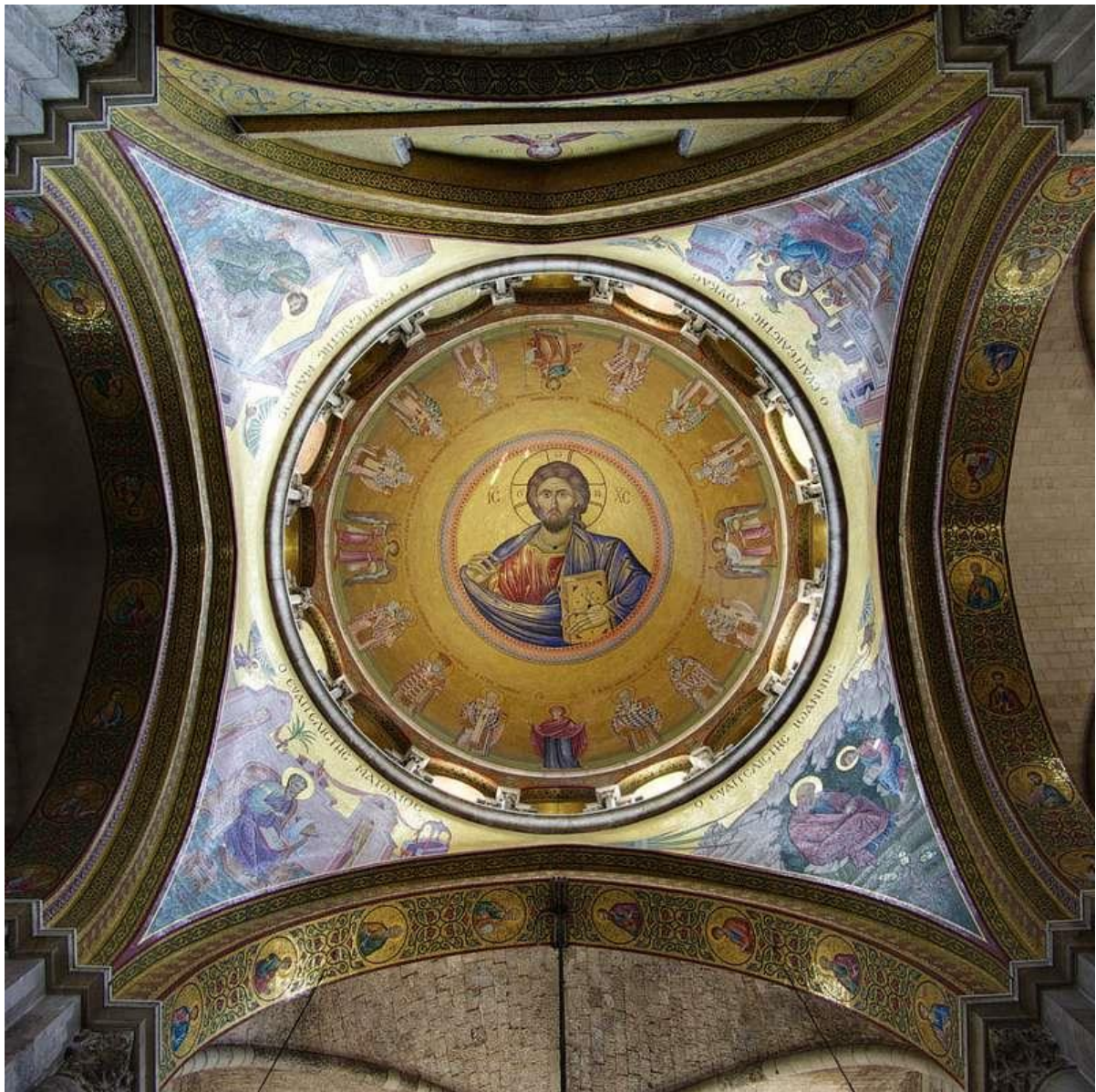
聖墓教堂內的耶穌聖像

處在於有兩個主教王座（通常只有一個），進入大廳可以在左邊（北方）看到「耶路撒冷主教王座」，以及右邊的「安提阿主教王座」。進入主教堂不久，馬上就能看到稱為翁法洛斯(Omphalos)的「石杯」，翁法洛斯在希臘神話故事中，是宙斯令兩隻鷹找到的「世界中心」。基督宗教認為：這個石杯是世界的中心，是重要的宗教象徵。原本石杯在兩個王座的中央，後來為了給信徒瞻仰，移到現在的位置，據說許願很靈喔。請別忘了抬頭欣賞圓頂，巨大的馬賽克畫作！數百萬的小石片，組成復活後的耶穌，各個耶路撒冷主教以及族長，環繞四周。4 個角落分別刻劃著：與小孩（天使）在一起的聖馬太、身穿綠袍的聖馬可、正在畫畫的聖路加和白髮的聖約翰，各個聖人之下均有巨柱，共同支撐起高聳的穹頂。在穹頂周圍共有 16 扇巨大窗戶，其中 8 扇是封閉的。這樣的設計是為了在不同的時間，使陽光形成光束，照耀特定主題。